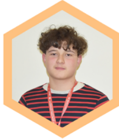
Antoine BEAUCHAMP Plomberie et Chauffage