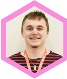
Mao VILLAIN Contrôle Industriel