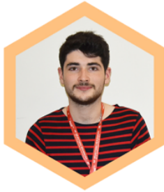
Ivanhoe BOISSIN Miroiterie