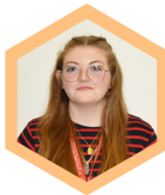
Albane HÉLIE Peinture et Décoration