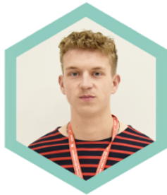
Hugo PLOS Câblage des Réseaux Très Haut Débit